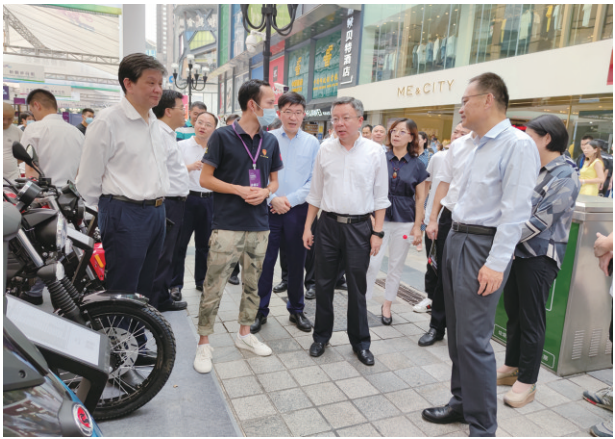
重庆市副市长李波参观宗申展位

7月25—27日,由商务部、重庆市人民政府等有关部门组织的“外贸优品汇扮靓步行街”活动,在重庆解放碑步行街隆重举行。海外畅销的“重庆造”集体大秀,赛科龙受邀参展,展露海外市场喜爱的“重庆造”风采。